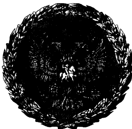
РИСУНОК НАГРУДНОГО ЗНАКА К ПОЧЕТНОЙ ГРАМОТЕ ПРЕЗИДЕНТА РОССИЙСКОЙ ФЕДЕРАЦИИ